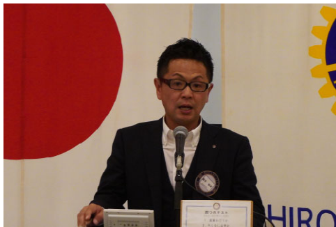
会長時間・就任挨拶

2023年7月6日(木) 第1069回例会 リーガロイヤルホテル広島 3階 安芸の間